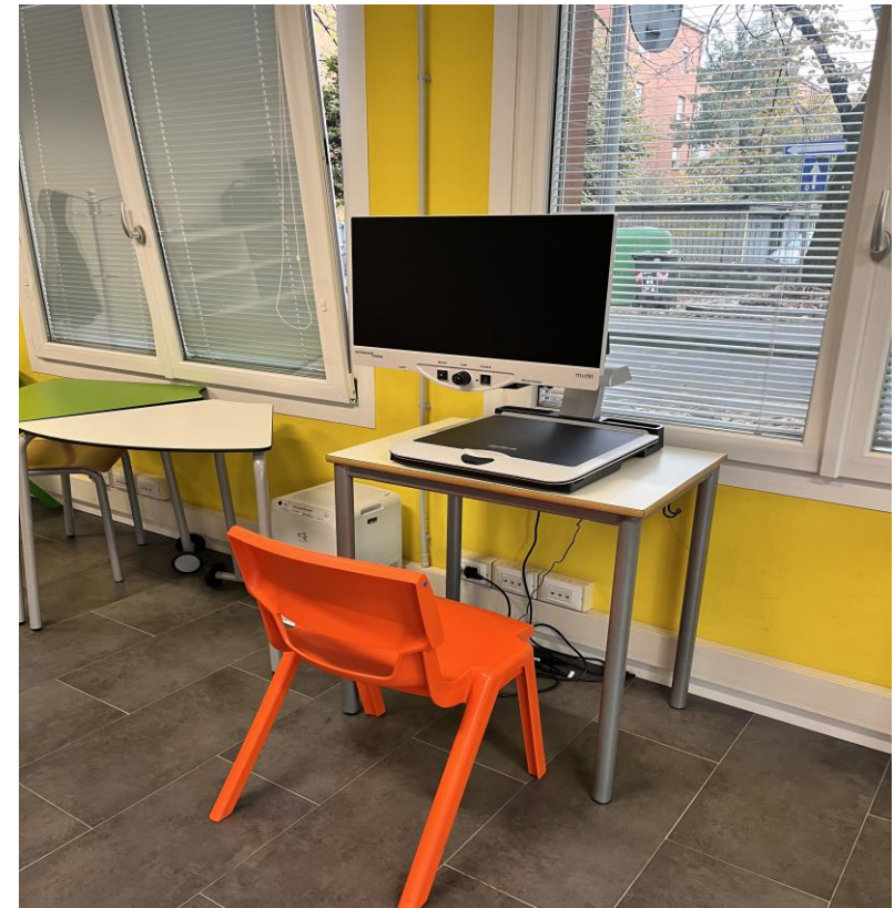
INGRANDITORE VISIVO DI TESTI E IMMAGINI