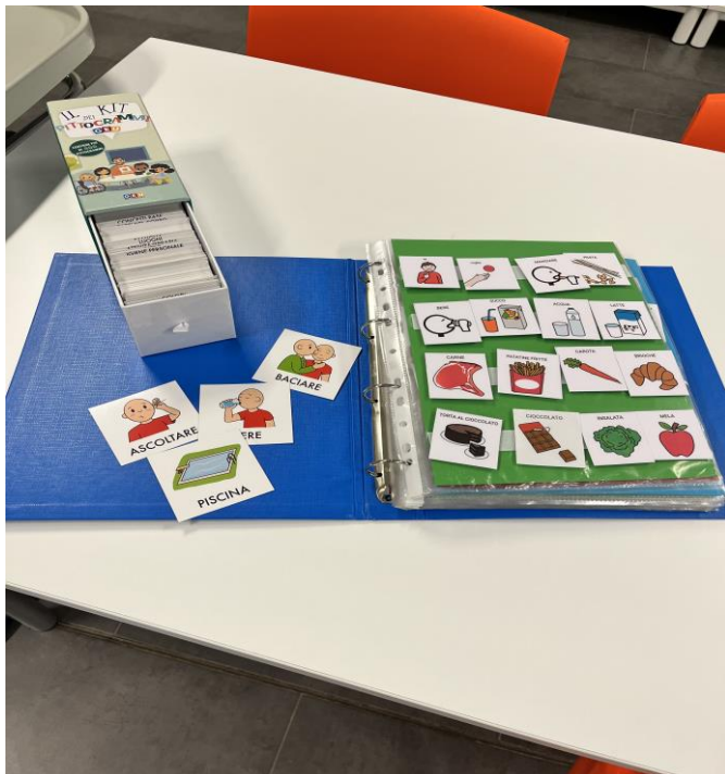
PECS PER COMUNICAZIONE AUMENTATIVA E ALTERNATIVA

LA PRESENZA DI STRUMENTI COMPENSATIVI E FACILITATORI COMUNICATIVI EVIDENZIANO L'ATTENZIONE A TUTTI I TIPI DI DIAGNOSI FUNZIONALE.